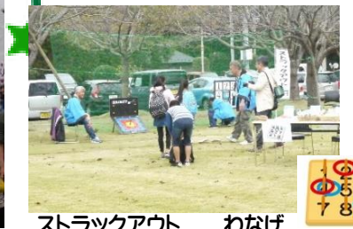
ストラックアウト わなげ