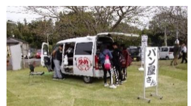
手作りパン屋さん