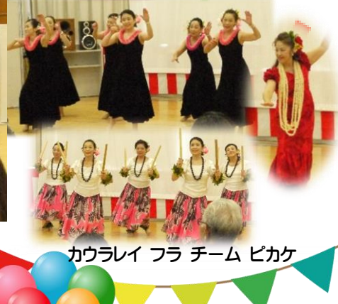
カウラレイ フラ チーム ピカケ