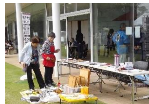
フリーマーケット