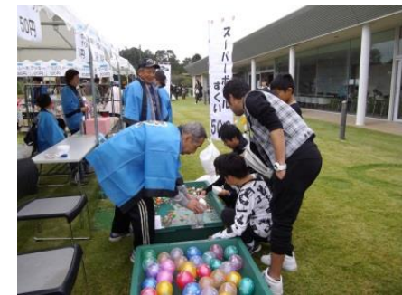
ス・パ・ホ・ールすくい ヨーヨーつり