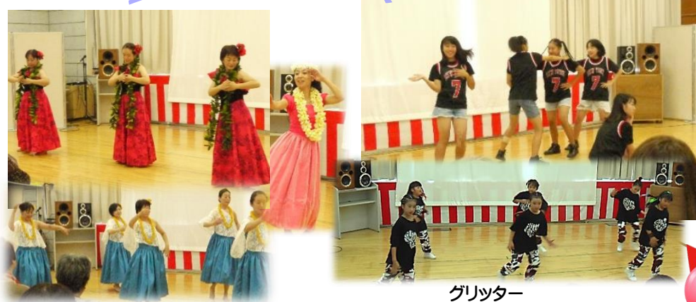
アロハ フラ レアリノ