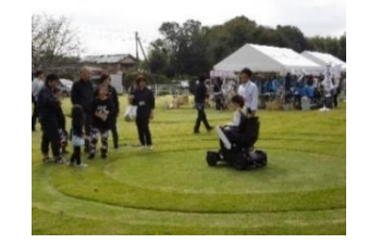
地域包括支援センター