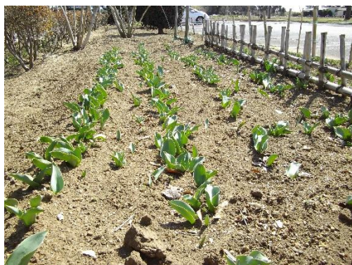
コミセンのチューリップ、キレイに咲きますように♪