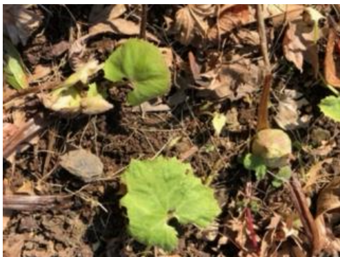
コミセンの裏庭ふきのとう