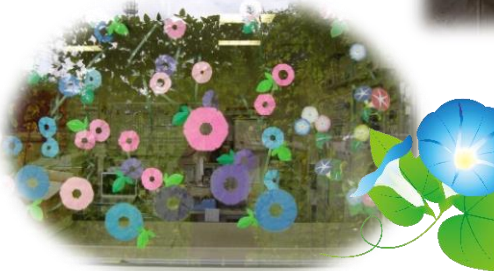
今年は窓にも朝顔のグリーンカーテンをしました。